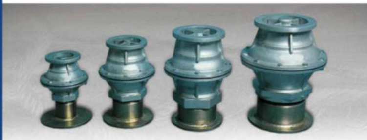
● АЛЮМИНИЕВЫЙ ГИДРАНТ С ЗАЩЕЛКИВАЮЩИМСЯ СОЕДИНЕНИЕМ