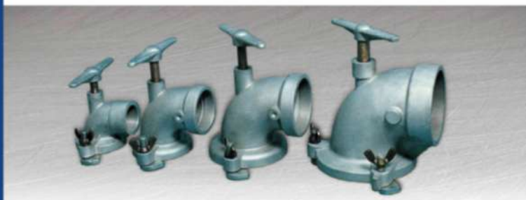
● АЛЮМИНИЕВЫЙ ОТВОД ГИДРАНТА С ЗАЩЕЛКИВАЮЩИМСЯ СОЕДИНЕНИЕМ