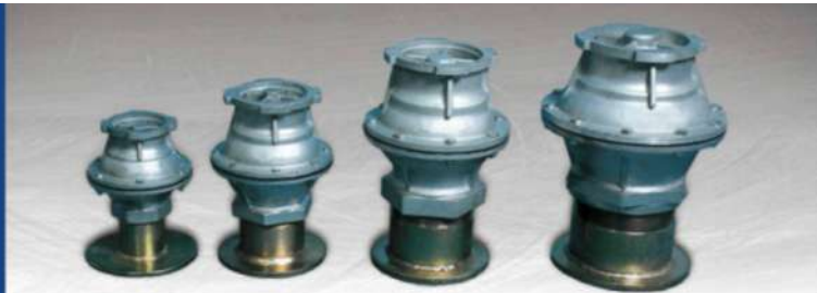
● АЛЮМИНИЕВЫЙ ГИДРАНТ СО ШТЫКОВЫМ СОЕДИНЕНИЕМ