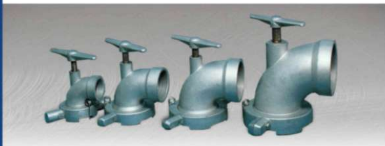
● АЛЮМИНИЕВЫЙ ОТВОД ГИДРАНТА СО ШТЫКОВЫМ СОЕДИНЕНИЕМ